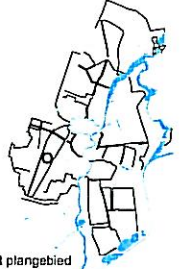
ligging van het plangebied

Goedgekeurd bij besluit van heden nr. 08-237 Haarlem, 7 JAN 2008 Gedeputeerde Staten van Noord-Holland, namens deze,